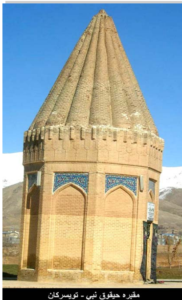
مقبره حقوق نبی - توپسراکان

وی نامش در کتاب عهدعتیق ذکر شده و مقام مذهبی خاص نزد پیروان دین یهود میباشد. حقوق در زبان عبری به معنای "در آغوش گرفته شده" میباشد. پدرش یسوعالیت و مادرش شونامیت بوده است. ایشان در ۶۰۷ سال قبل از میلاد همزمان با سلطنت یهویراحیم و بعد از اشعیا نبی، نبوت میکردند. حقوق در حدود ۶۵۰ الی ۷۰۰ سال قبل از میلاد مسیح در اواخر سلطنت یوشیا و در عصر دانیال نبی میزیسته و دانیال را ملاقات نموده است. آرامگاه حقوق نبی در توپسراکان طی قرون متمادی چندین بار بازسازی شده است. این آرامگاه یکی از قدیمی ترین آثار تاریخی ایران محسوب می شود.