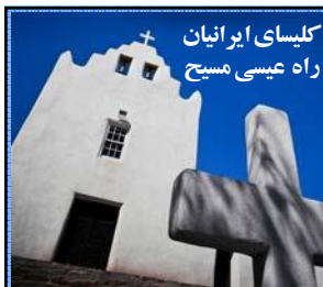
کلیسای ایرانیان راه عیسی مسیح