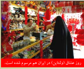
روز عشاق (ولنتاین) در ایران هم مرسوم شده است.